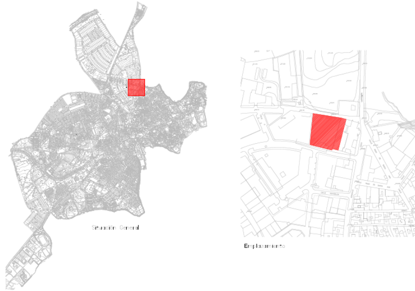
(PLANO DE SITUACIÓN Y EMPLEZAMIENTO)

Este complejo docente, cultural y deportivo constará de dos plantas de altura con sótano y estará compuesto por un pabellón multifuncional para uso cultural y deportivo y salas, aulas y despachos de uso docente.